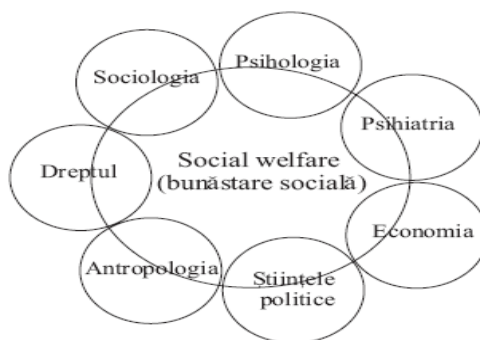
Fig.1: Paradigma interconexiunii dintre asistența socială și alte discipline în cadrul sistemului Social Welfare, adaptare realizată de Antonio Sandu după Charles Zastrow 2002.

Vom pleca de la prezentarea și interpretarea realizată de Antonio Sandu (2008) a unui model propus de profesorul american Charles Zastrow ca posibilă paradigmă a interconexiunii dintre asistența socială și alte discipline în cadrul sistemelor de Social Welfare (bunăstare socială):