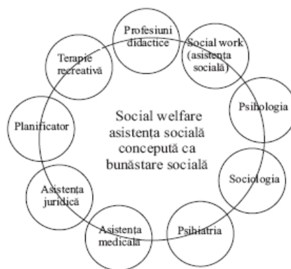
Fig. 2: Paradigma principalelor tipuri de profesii utilizate în munca asistențială, adaptare realizată de Antonio Sandu după Charles Zastrow (2002).

Considerând domeniul „bunăstării sociale” ca pe o zonă interdisciplinară de activitate profesională legată direct de creșterea calității vieții indivizilor.